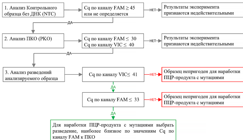
Схема 1 – анализ разведений исследуемого образца